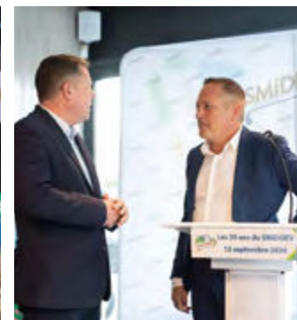
Le SMIDDEV fête ses cinquante ans en septembre dernier.

acquisition de bacs pour les collectes sélectives ou encore sensibilisation à la prévention et à la réduction des déchets. Estérel Côte d'Azur Agglomération, qui exerce quant à elle la compétence de la collecte des déchets ménagers sur son territoire, contribue au financement du SMIDDEV pour ses missions de traitement et de valorisation des déchets collectés. En cinquante ans, les progrès en matière de recyclage sont notables. Si la totalité