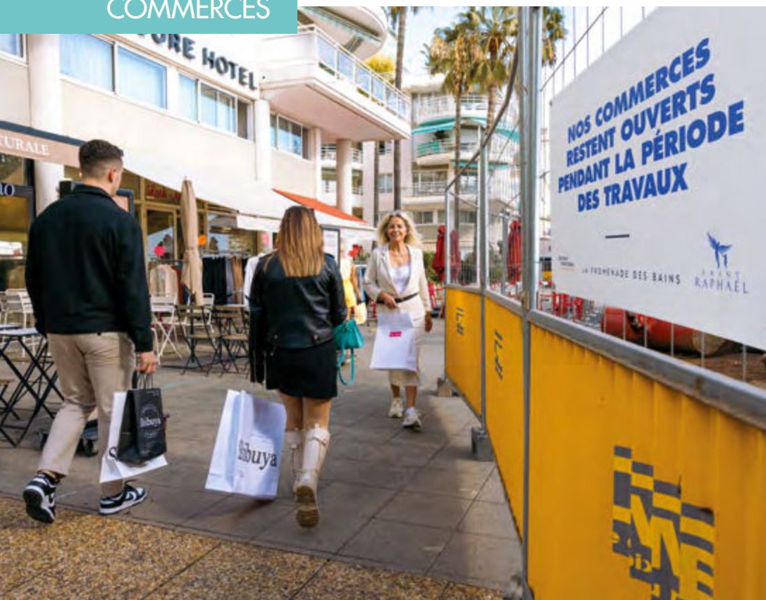
L'activité commerciale se poursuit sur la promenade René Coty malgré les travaux

Durant cette période de transition, Saint-Raphaël demeure une commune vivante, où les commerces jouent un rôle essentiel, tant sur le plan économique que social. Véritables lieux d'échange et de partage, les enseignes raphaëloises contribuent à l'attractivité de la ville et à la création de liens sociaux. Leur présence, active et dynamique préserve son identité, tout en offrant à chacun des services accessibles.