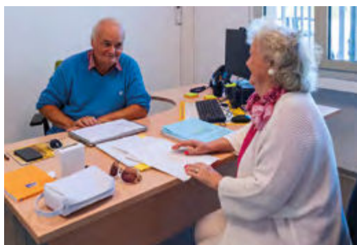
Entretien avec un conciliateur à la Maison France Services.

Les usagers sont accueillis et accompagnés dans leurs démarches par les deux agents présents sur place, qui les guident aussi dans l'utilisation des outils numériques.