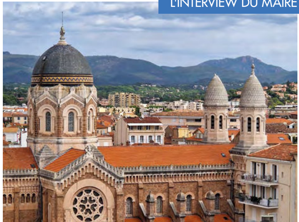
Une des trois croix qui agrémentent les dômes de la basilique Notre-Dame-de-la-Victoire a été détruite après avoir été touchée par la foudre

Pour bâtir un avenir serein, il faut poser des bases solides car la France dispose de nombreux atouts. Il ne faut pas avoir peur de l'audace ni de la transformation de notre société, si nous savons en être collectivement les acteurs, au-delà des différences d'opinions. Il faut nous rassembler car c'est ensemble que nous pouvons envisager le futur avec lucidité et optimisme. L'avenir repose aussi sur la jeunesse, et comme je l'ai dit précédemment, je suis fier de constater qu'à Saint-Raphaël, notre jeunesse est engagée et s'intéresse à l'histoire et au développement de notre Ville.