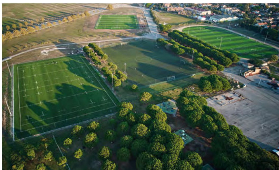
Les terrains de sport à la Base Nature ont été rénovés en 2022.

À Saint-Raphaël, c'est au centre tennistique de Roland Garros que l'Agglomération a apporté un soutien massif de 1,8 million d'euros pour moderniser ces infrastructures emblématiques. En parallèle, 1,9 million d'euros ont été alloués à la commune pour la réfection des voiries, l'aménagement des trottoirs et la modernisation de l'éclairage public. Dernièrement, 1,2 millions d'euros ont été attribués pour le renouvellement en LED du patrimoine d'éclairage public sur voirie.