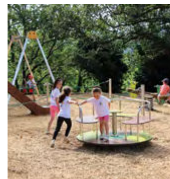
Le parc sportif et de loisirs de la Source aux Adrets de l'Estérel a été inauguré en juin dernier.

répondre aux besoins locaux et de favoriser des projets concrets, qui participent à la construction d'un territoire équilibré et solidaire. Loin d'être une simple entité administrative, l'Agglomération se présente comme un acteur engagé au service des communes et des habitants.