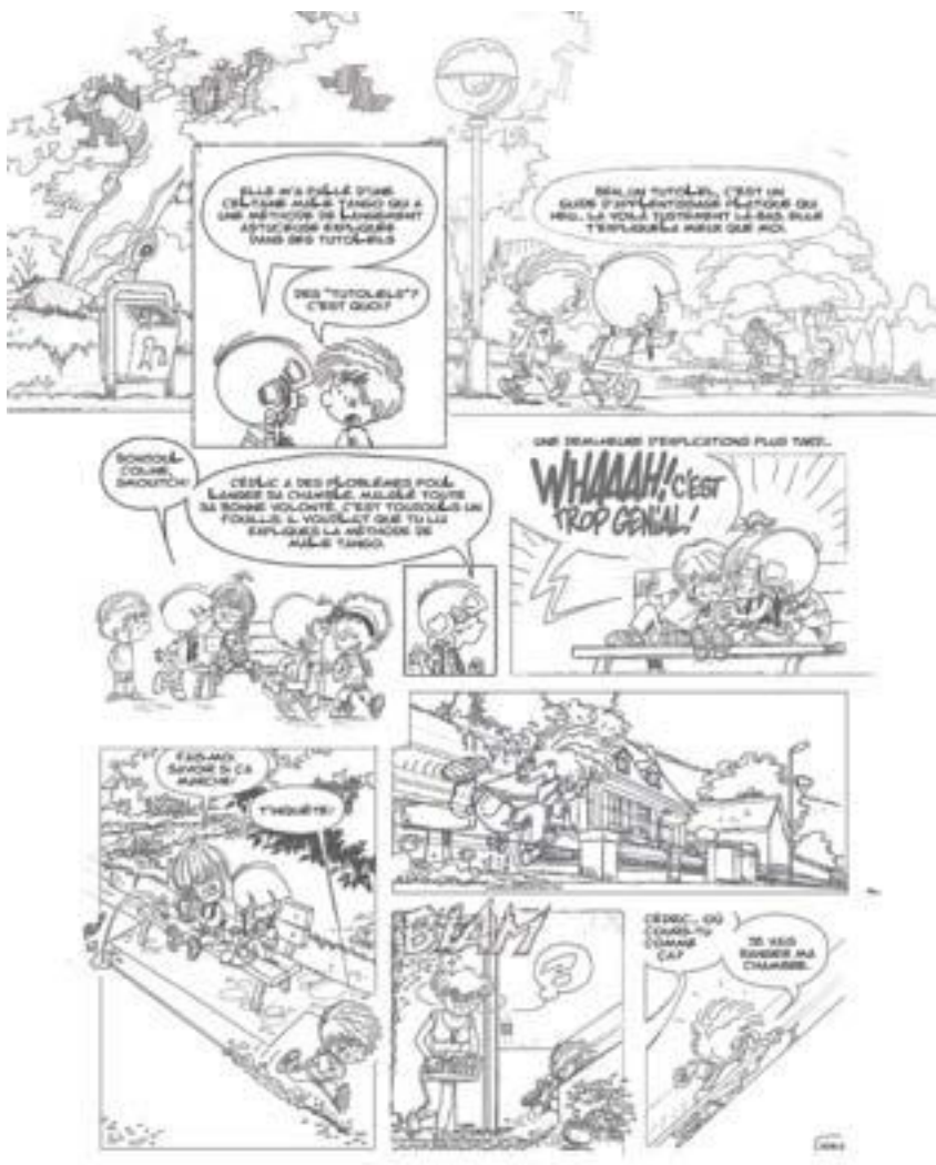
Une planche exclusive du 37 e album à paraître

Le Festival de la Bande Dessinée et de la Jeunesse de Saint-Raphaël est de retour au Palais des Congrès, pour une septième édition à la croisée des mondes. Entre mangas, littérature adolescente et albums pour petits et grands enfants, le programme s'annonce riche : ateliers créatifs, dédicaces et exposition sur le thème du manga. 18 auteurs internationaux iront à la rencontre du public, dont un invité d'honneur : Tony Laudec, le talentueux dessinateur de la saga Cédric. Rencontre avec cet artiste qui place la passion au cœur de son travail.