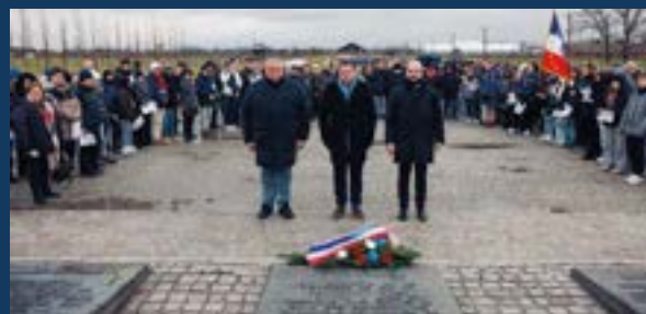
Un moment de recueillement et de réflexion sur le poids de l'Histoire.

Auschwitz-Birkenau, tristement célèbre en tant que plus grand camp de concentration et d'extermination nazi, a été le lieu de la mort de près d'un million de personnes. Ces victimes étaient principalement juives, mais comprenaient aussi des Roms, des handicapés, des homosexuels, des prisonniers de guerre et des opposants politiques. Ce lieu symbolise le devoir de mémoire pour que de telles atrocités ne se reproduisent jamais.