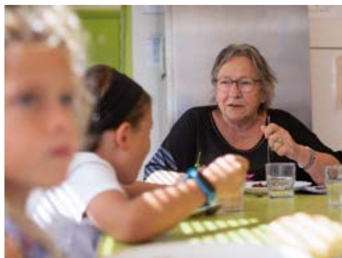
Restauration en commun à la cantine de l'école du Dramont.

Jardinage au square Suaton : Au square Suaton, jouxtant la résidence Les Acacias, des bacs de plantation ont été créés par la Ville. Ces espaces permettent à des écoliers et des pensionnaires de se retrouver autour de thématiques liées à l'écosystème des jardins.