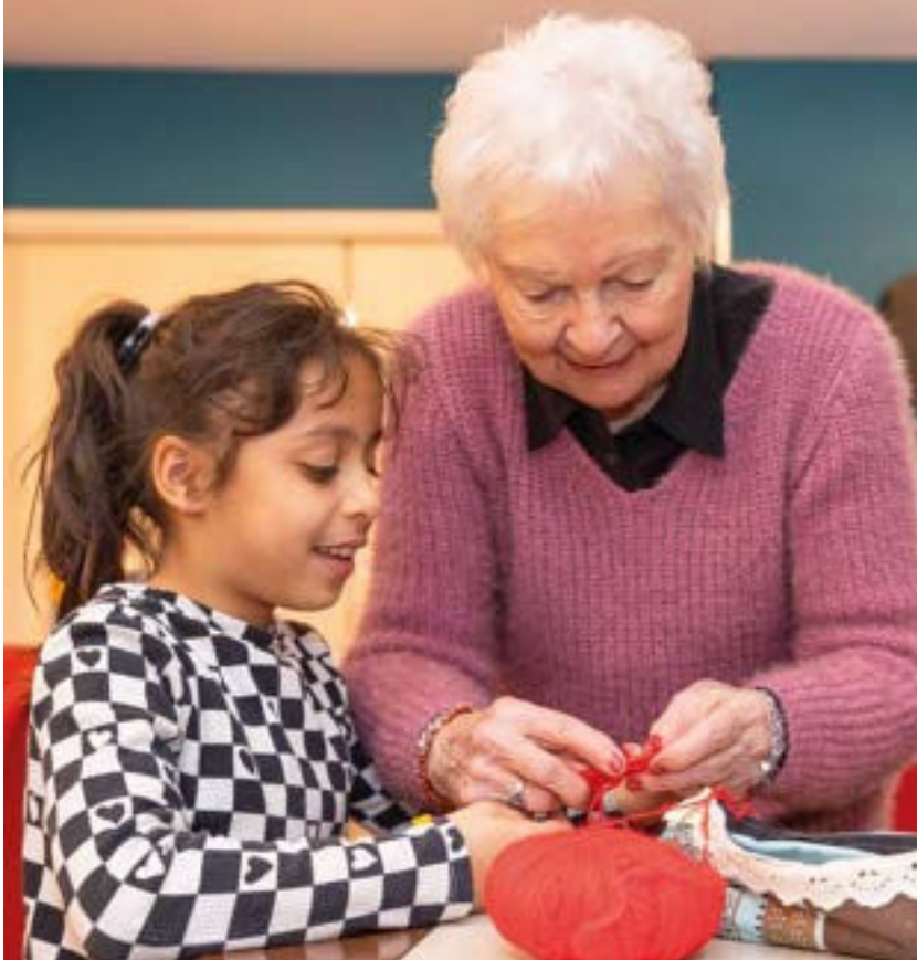
Atelier intergénérationnel organisé dans le cadre du Passeport du civisme à la résidence Domitys. À droite: atelier de peinture à l'Espace d'activité du Dramont.