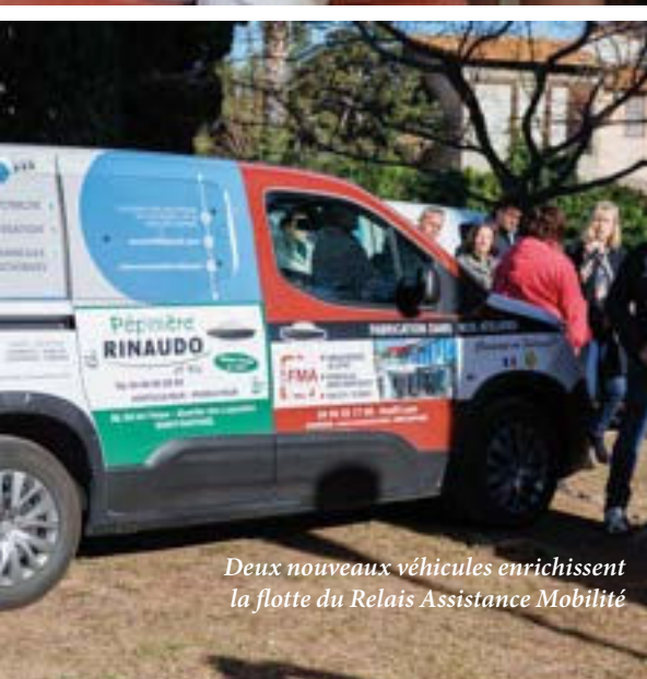
Deux nouveaux véhicules enrichissent la flotte du Relais Assistance Mobilité

i Pour s'inscrire ou réserver une course, contactez le Pôle autonomie – Relais Assistance Mobilité : Tél. 04 94 19 51 28