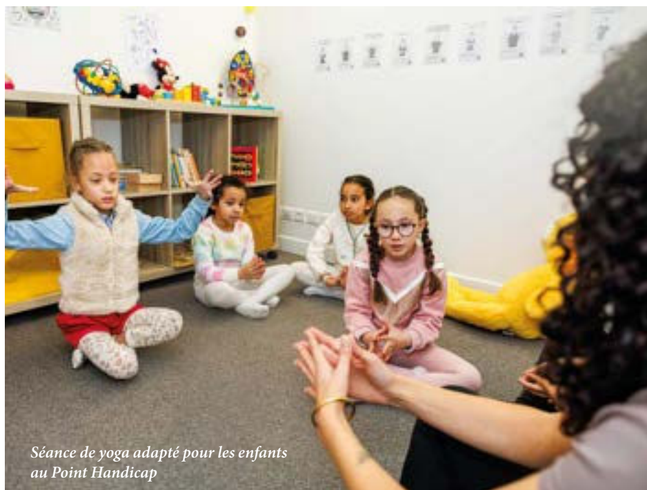
Séance de yoga adapté pour les enfants au Point Handicap