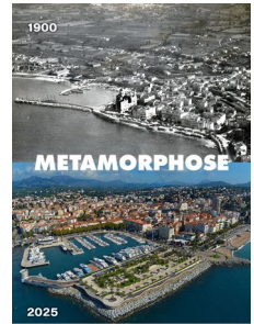
LES RUES COMMERÇANTES DE SAINT-RAPHAËL DE 1900 À 2025 Hall du centre Culturel George GINESTA du 08 au 18 Avril 2026 de 9h à 19h