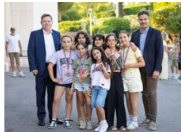
Remise des prix du Passeport du Civisme

Enfin, il faut clarifier les responsabilités. Trop souvent, les compétences sont partagées entre plusieurs niveaux administratifs, ce qui rend les décisions plus longues et moins lisibles pour les citoyens. Une action publique plus simple, plus proche et plus responsabilisante serait bénéfique à la fois pour les collectivités et pour les habitants.